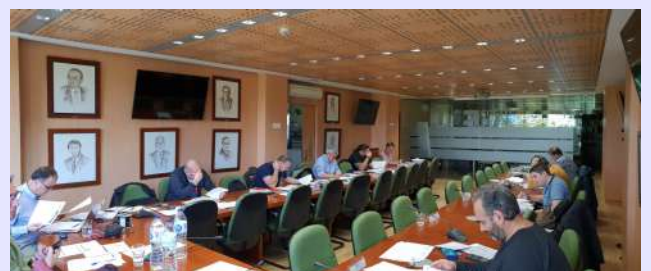
La nueva Convocatoria tuvo lugar el pasado 17 de noviembre, en la sede del COGITI.

Por otra parte, el Servicio de Certificación de Personas, en su mejora continua, y como consecuencia de las peticiones de muchos compañeros, está realizando los trámites necesarios con ENAC para ampliar la acreditación existente de Verificadores de Líneas de Alta Tensión no superior a 30kV (LAT), añadiendo la de Centros de Transformación (CCTT), todo ello acorde a la norma UNE-EN ISO IEC 17024. Esta convocatoria es exclusiva para aquellos técnicos que, disponiendo de la Certificación como Verificadores de Líneas de Alta Tensión no superior a 30kV, quieran ampliar la misma con la de Centros de Transformación. El pasado 17 de noviembre se realizó la segunda convocatoria.