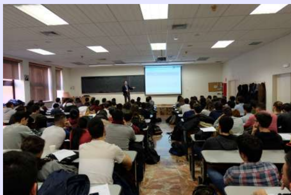
La conferencia reunió a numerosos alumnos de la Escuela Politécnica Superior de la Universidad Carlos III de Madrid.